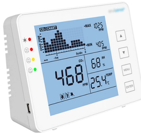
Figure : Exemple d'instrument de mesure du \text{CO}_2 avec information sur l'évolution de la concentration de \text{CO}_2