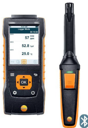
Figure : Exemple d'instrument de mesure du CO 2 portable.

Un instrument qui affiche directement la valeur mesurée sur un écran présente l'avantage de pouvoir réaliser facilement une mesure instantanée, et éventuellement une information directe des occupants dans le local.